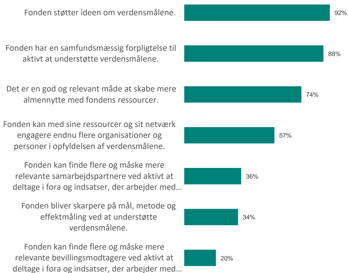
Figur 2: Rationaler for at støtte verdensmålene

Der er forskellige årsager til, at fondene støtter verdensmålene. Vi har spurgt til rationalet hos de fonde, der enten har truffet en beslutning om at starte helt nye verdensmålsrelaterede initiativer, samt dem, som overvejer at starte nye initiativer. Figuren herunder viser rationalerne hos disse fonde.