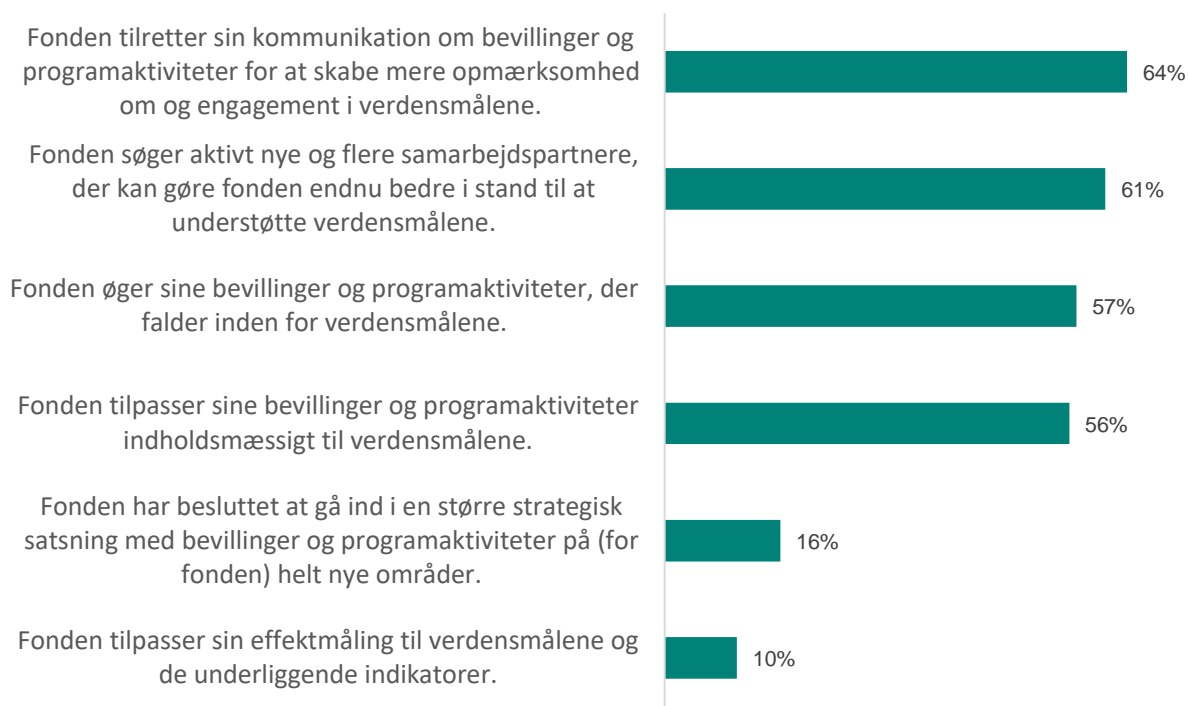
Figur 4: Hvordan understøtter fonden, der har startet helt nye verdensmålsrelaterede aktiviteter, verdensmålene via bevillinger og programaktiviteter

For at få mere at vide om, hvordan fonde, der har startet helt nye verdensmålsrelaterede initiativer, har støttet, har vi bedt dem uddybe, hvordan de understøtter verdensmålene gennem bevillinger og programaktiviteter.